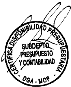
MATÍAS DESMADRYL LIRA Director General de Aguas Ministerio de Obras Públicas