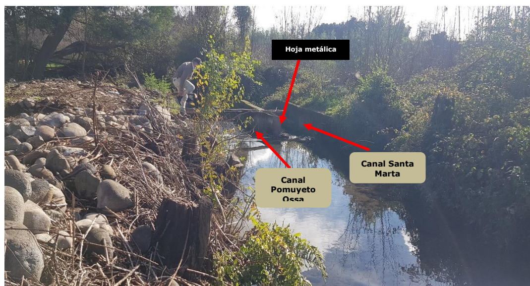
Figura N° 2: bocatoma Canal Pomuyeto Ossa y Canal Santa Marta.