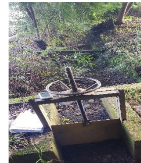
FOTOGRAFÍA N° 5.

Punto de entrega de los derechos captados por el Canal Pomuyeto Ossa, asociados a Sociedad Agrícola y Ganadera Los Gómeros Ltda.