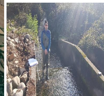
FOTOGRAFÍA N° 2.

Obra de arte, asociada a la bocatoma Principal de 3 canales, ubicada en la ribera Derecha del río Ñuble.