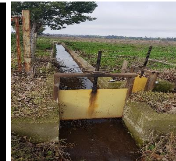
FOTOGRAFÍA N° 4.

Punto de entrega de los derechos captados por el Canal Pomuyeto Ossa, asociados a don Víctor Ascencio Burgos.