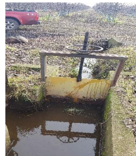
FOTOGRAFÍA N° 5.

Punto de entrega de los derechos captados por el Canal Pomuyeto Ossa, asociados a don Juan Tapia Rosales..