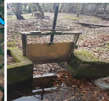
FOTOGRAFÍA N° 3.

Realización de aforo volumétrico, en la Bocatoma Canal Pomuyeto Ossa.