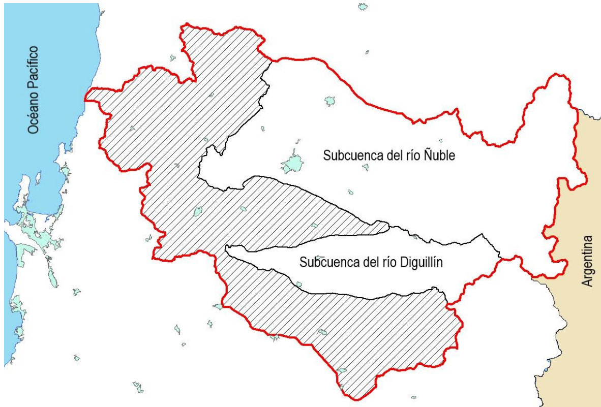
Figura 2. Jurisdicción de la Junta de Vigilancia del Río Itata y sus Afluentes.