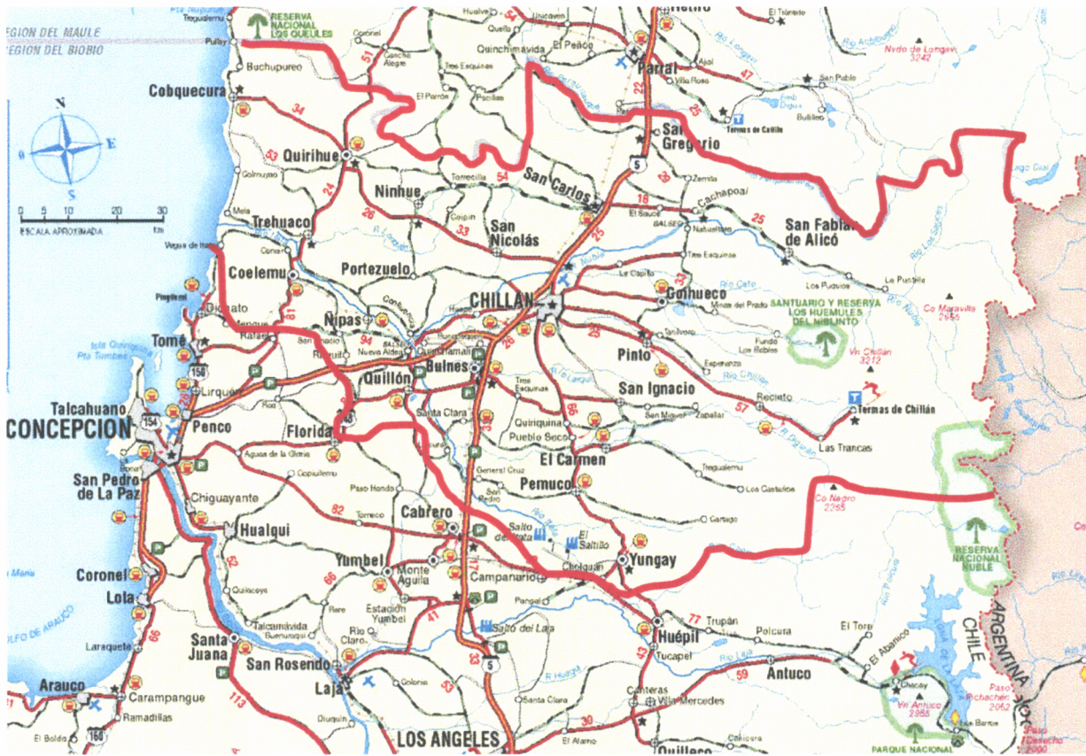
FIGURA 1-1 ÁREA DE ESTUDIO REGIONAL

Dicho estudio ha sido dividido en 6 Etapas, agrupando cada una de ellas un conjunto de comunas pertenecientes a la provincia considerada, según se especifica en el Cuadro 1-1.