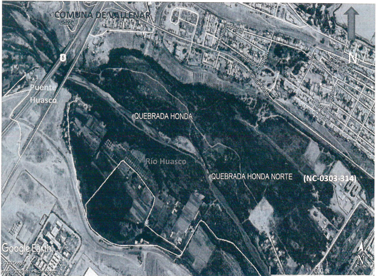
Figura N° 2. Ubicación georreferenciada de las bocatomas de los canales Quebrada Honda y Quebrada Honda Norte.