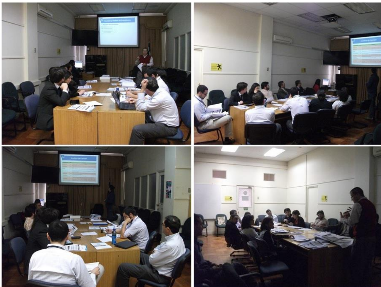
FIGURA 6-1 IMÁGENES TALLER DE TRABAJO CON FUNCIONARIOS DGA.